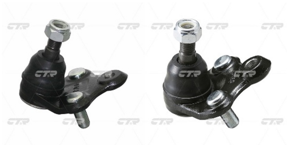
Рис.1. Кульові опори СВТ-40 (зліва) та СВТ-46 (справа)

Розглянемо на прикладі двох кульових опор, що візуально схожі між собою. Це кульові опори бренду CTR: СВТ-40 та СВТ-46. Обидві деталі мають перелік автомобілів для яких вони призначені і навіть перетинаються на моделі Toyota Corolla (версії AE101, 102, але в різних модифікаціях).