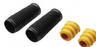
Захисний комплект стійки амортизатора