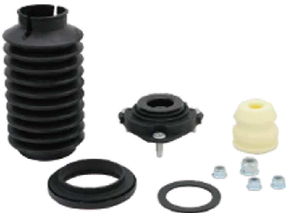
Ремкомплект опори стійки амортизатора GSP