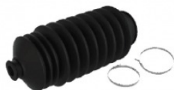
Комплект пильника рульової рейки