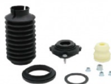
Ремкомплект опори стійки амортизатора