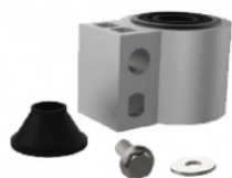
Комплект опори двигуна