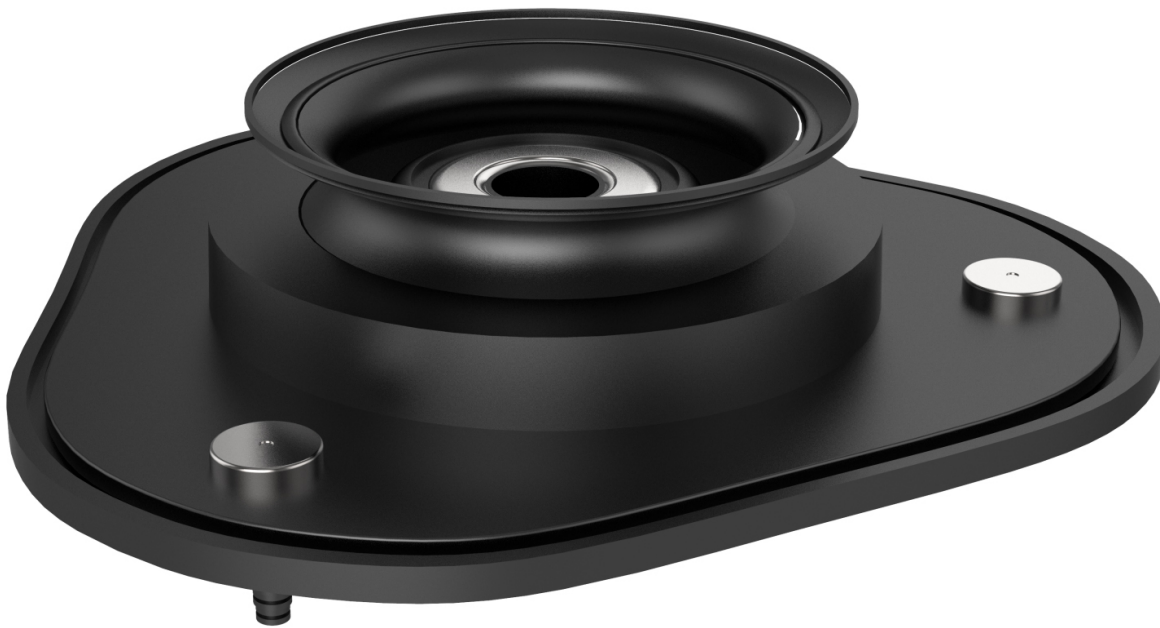
Опора амортизатора GSP