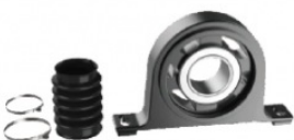
Опорний підшипник карданного вала