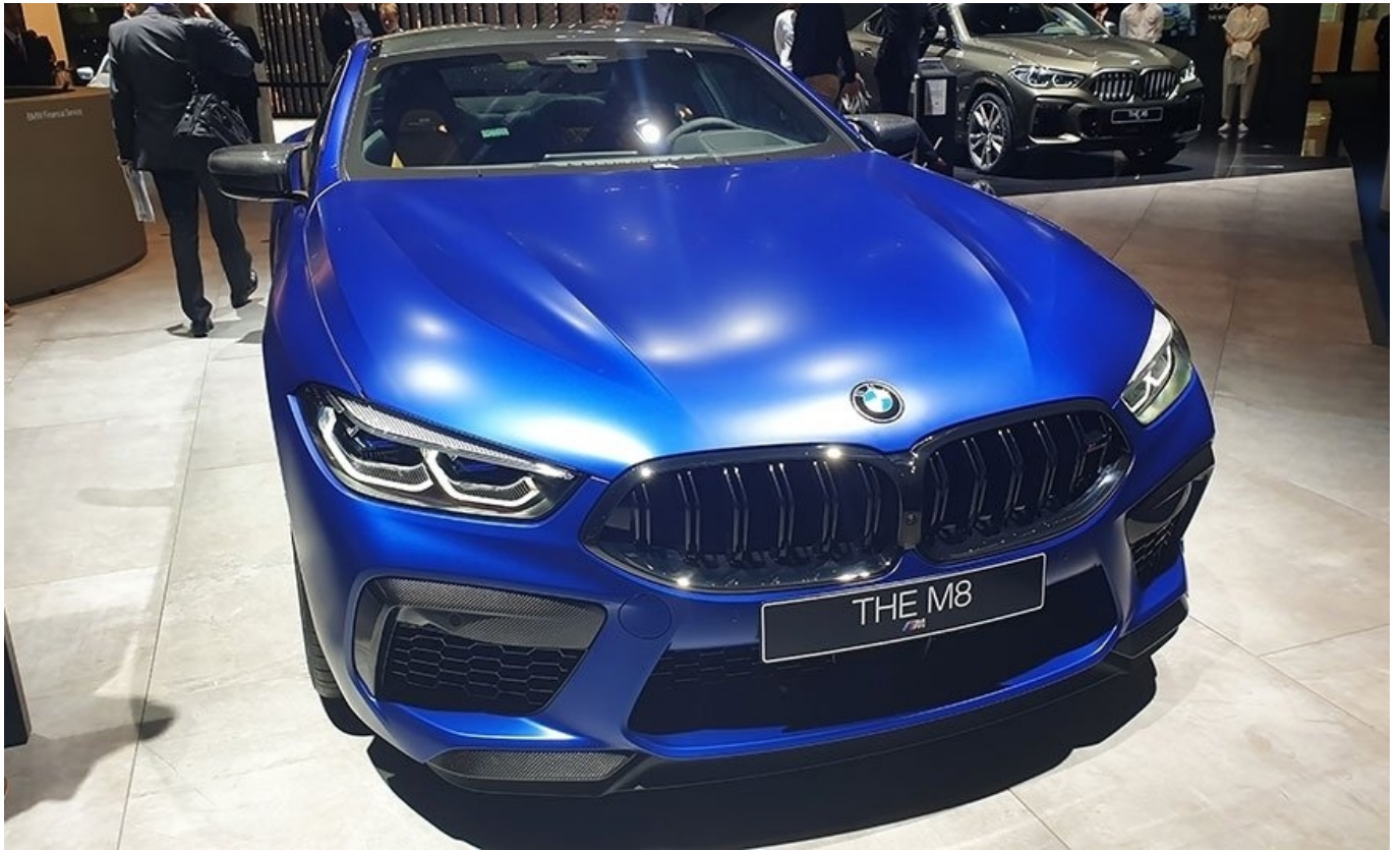
Фото. Нові кольори, які пропонують автовиробники, як правило, сатинові, а не повністю матові.

Автомобілі з матовим покриттям вже стали звичним явищем на наших вулицях. Ще близько 10 років тому автомобілі з таким покриттям траплялися дуже рідко, зазвичай це були дуже дорогі спортивні автомобілі, і часто покупцю потрібно було чимало доплатити за такий тип покриття.